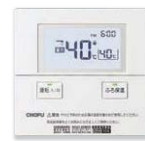
台所リモコン CMR-2704V 非防水形