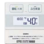
台所リモコン CMR-2901 [非防水形]