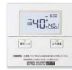
台所リモコン CMR-2704V [非防水形]