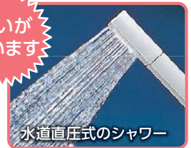
水道直圧式のシャワー