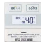
台所リモコン CMR-2901 非防水形