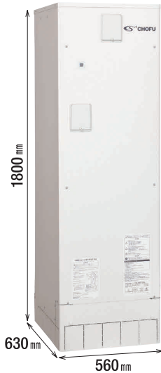
※脚部カバーは別売品です。