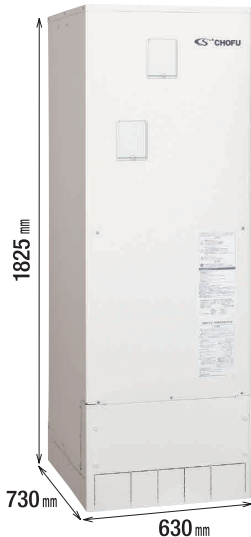
※脚部カバーは別売品です。

標準圧力 85kPa 「深夜電力通電制御」専用 本体操作タイプ 角型 ステンレスヒータ