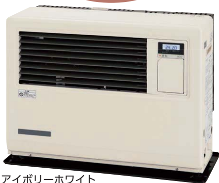
アイボリーホワイト