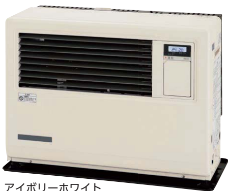
アイボリーホワイト